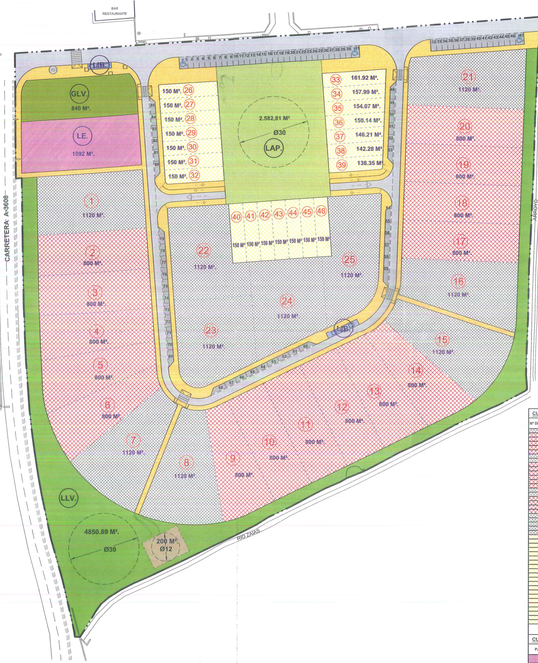
CUADRO DE CARACTERISTICAS DEL SUELO RESIDENCIAL